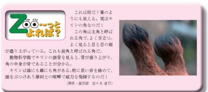
すづくり誌面「Zoo〜つとよれば？」の一例（キリンの角）

各回、会場で希望者を受け付けます。職員の解説を聞きながら、双眼鏡を使ってじっくり細部まで動物を観察してもらいます。なお、観察内容は「Zoo〜つとよれば？」で実際に紹介された内容に限られません。