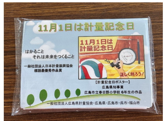
配布する計量記念日ティッシュ

経済産業省では、社会全体の計量制度に対する理解の普及を図るために、昭和27年から「計量記念日」を定めている。現在は、現行の計量法が施行された11月1日を「計量記念日」とし、計量制度の普及や社会全体の計量意識の向上を目指している。