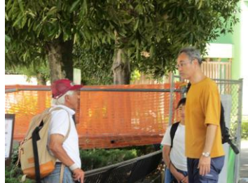
(お客さんと談笑中)