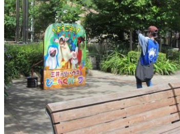
(走り寄りカメラマンに)