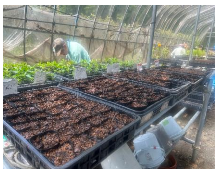
手前3つが腐葉土と赤玉土 向こう側2つがマグアンプなど調合

今回赤玉土と腐葉土だけを調合した土をそれぞれをポットに土を入れマレーゴールドの種を2粒ずつ蒔く さて発芽やその後の成長はどうなるでしょう？