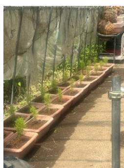
コキアをプランターに移植