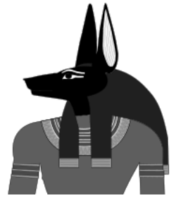
アヌビス神