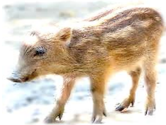
イノシシの子ども(ウリ坊)

イノシシは子どものころ、体に白色のたてじまがあり、体型が丸っこいため、野菜のウリ(マクワウリ)に似ています。