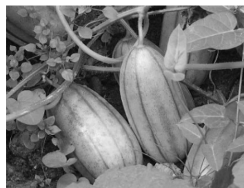
マクワウリ(ウイキペディアより)