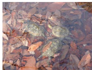
ぴーちくパーク内のカメ池。冬期は落ち葉を水中に敷きつめます。

イシガメは越冬も水中で行います。越冬中は代謝機能が低下し、必要な酸素は総排出口内(直腸の粘膜)からの吸収でまかなえるため、外敵の少ない水中で越冬できるのです。