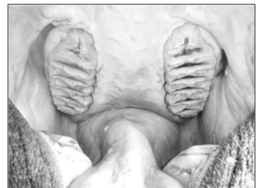
サバンナゾウの口内

サバンナゾウ(アフリカゾウ)の学名は Loxodonta (傾いた歯) africana (アフリカの)となっており、これはアフリカゾウの歯の噛み合わせ面が傾いていることに由来します。